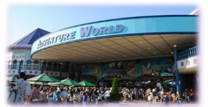
(アドベンチャーワールド)