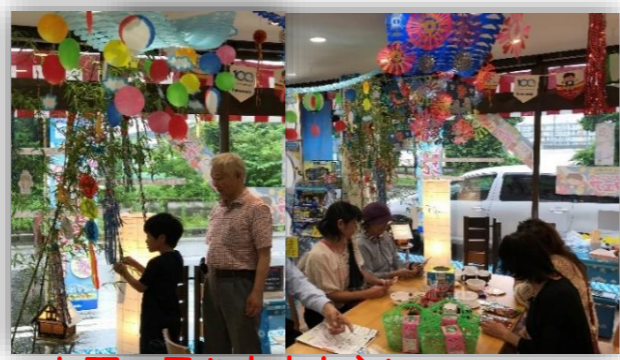
お願い届きますように。