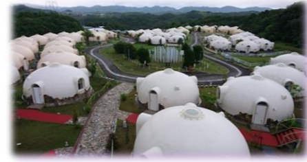
(とれとれビレッジ)

先日、和歌山で姪っ子の結婚式があり、レンタカーを借りて娘夫婦一家と一緒に行ってきました。結婚式は海辺のお洒落なロケーションに建っているホテルで行われ、姪っ子のウェディングドレス姿もとても素敵でした。せっかく和歌山まで行ったので、以前から行きたかったアドベンチャーワールドへ寄ったんです。そう！パンダを見てきたのです！！エントランスを散歩しているペンギン、サファリパークの堂々としたライオンたち、悠々としたキリン、イルカショー、小動物のアニマルアクション、バックヤード見学、そして🐼パンダたち。食事の🐼たちはとっても可愛くて、何といっても並ばずに好きな時間見られたのが良かったです。満喫したぁ〜。そして夜は「とれとれビレッジ」に宿泊。楽しい旅行でした。 Y