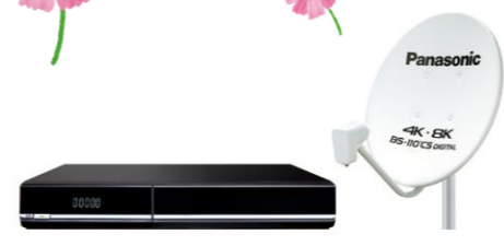
4K対応のチューナーまたはセットトップボックス、アンテナなど