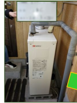
石油ボイラーから エコキュート