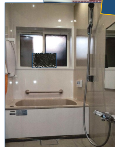
お風呂の リフォーム 補助金対象箇所 高断熱浴槽 節湯水栓 浴室乾燥機 手すり 入口の幅と段差解消