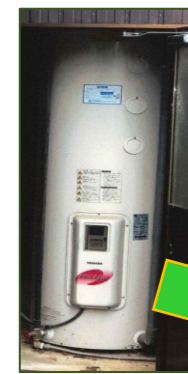
電気温水器から エコキュート