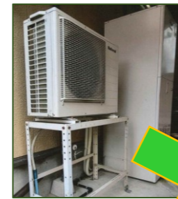
エコキュートから エコキュート